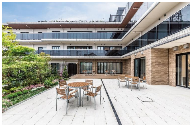
1階中庭・カフェスペース

ホームページ: https://as-heim.com/facility/mitaka/