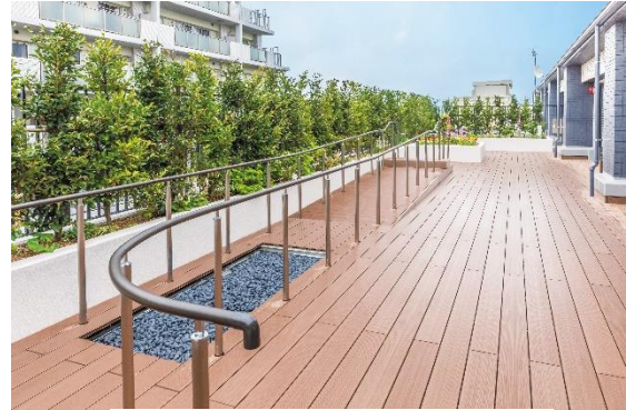
屋上庭園の歩行訓練スペース

4階に機能訓練エリアを設け、眺望と庭園を楽しみながら、機能訓練に取り組んでいただきます。庭園エリアにも歩行棒、傾斜や階段部、砂利を敷き詰めたゾーンなどを設け、緑と青い空に囲まれた中で多様な歩行訓練を提案します。