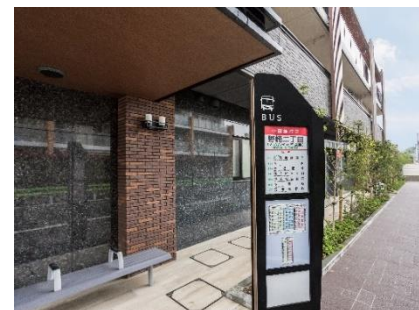
歩道スペースとバス停

今回、三鷹市からのリクエストを受けて、敷地内に約1.5mの歩道スペースを確保し、バス停の待合のための椅子や、ホームの庇を活かして雨よけもできるエリアを設けました。